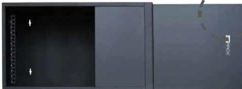
Porta scorrevole lateralmente Nessuna cerniera vulnerabile

Struttura reversibile Può essere installato con apertura della porta sia a destra che a sinistra.