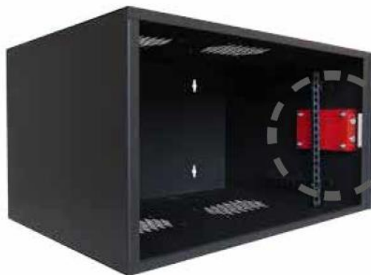
Serratura a doppia mappa